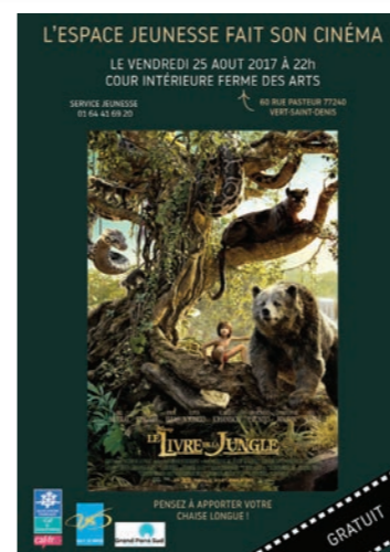
Cinéma de plein air à la Ferme des arts, le 21 juillet et le 25 août.