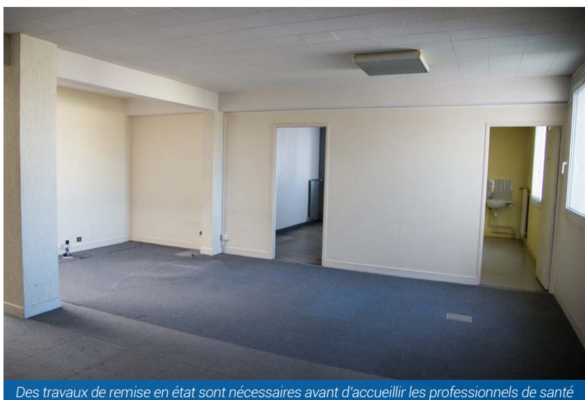
Des travaux de remise en état sont nécessaires avant d'accueillir les professionnels de santé

le cabinet médical nécessite lui quelques travaux pour un montant de 300 000 € environ et ne sera opérationnel que début 2020. Les élus ont précisé que cet investissement d'un montant de 500 000 € a été possible car les finances communales sont saines et cela permettra d'avoir la maîtrise des loyers afin d'attirer les médecins. Des travaux de reconfiguration des abords et du parking sont aussi à l'ordre du jour, afin de sécuriser le lieu et le rendre plus attractif. Le centre accueillera, en plus de l'ostéopathe qui est restée, des infirmiers, un pédiatre, des médecins de PMI, un audioprothésiste et sans doute un psychologue. Une synergie va ainsi s'opérer pour attirer de futurs médecins généralistes, dans un département classé bon dernier en nombre de médecins, où les collectivités comme Vert-Saint-Denis cherchent des solutions à cette désertification médicale.