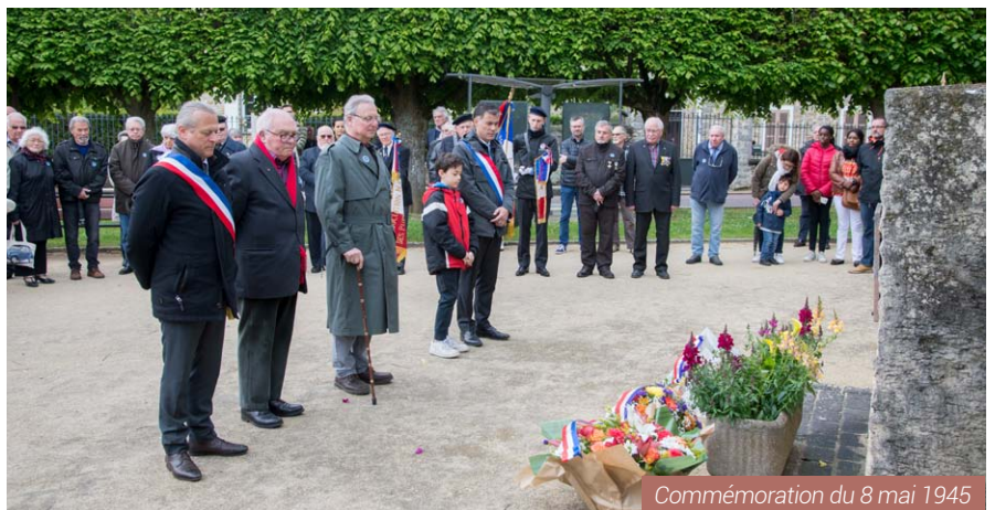
Commémoration du 8 mai 1945

■ Le 8 mai 1945 , la victoire des nations alliées consacrait la victoire de la démocratie, des valeurs universelles de la liberté et de la dignité humaine. Les jeunes élus du CME (Conseil municipal des enfants) ont pris part à cette cérémonie du souvenir en lisant des poèmes. La batterie Fanfare de Sénart était également présente et a joué avec beaucoup d'émotions. Un jeune porte-drapeau de l'Association nationale des pupilles de la nation, orphelins de guerre ou du devoir (ANPNOGD) était présent aux côtés des anciens. Olivier Faure, le député de la circonscription a aussi pris part à la commémoration.