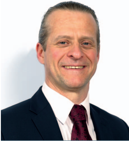
Éric BAREILLE Maire de Vert-Saint-Denis