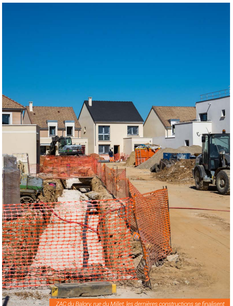
ZAC du Balory, rue du Millet, les dernières constructions se finalisent

Le PLU et ses plans de zonage (cartographie) sont consultables sur le site de la ville, rubrique : « Démarches et services », puis Urbanisme.