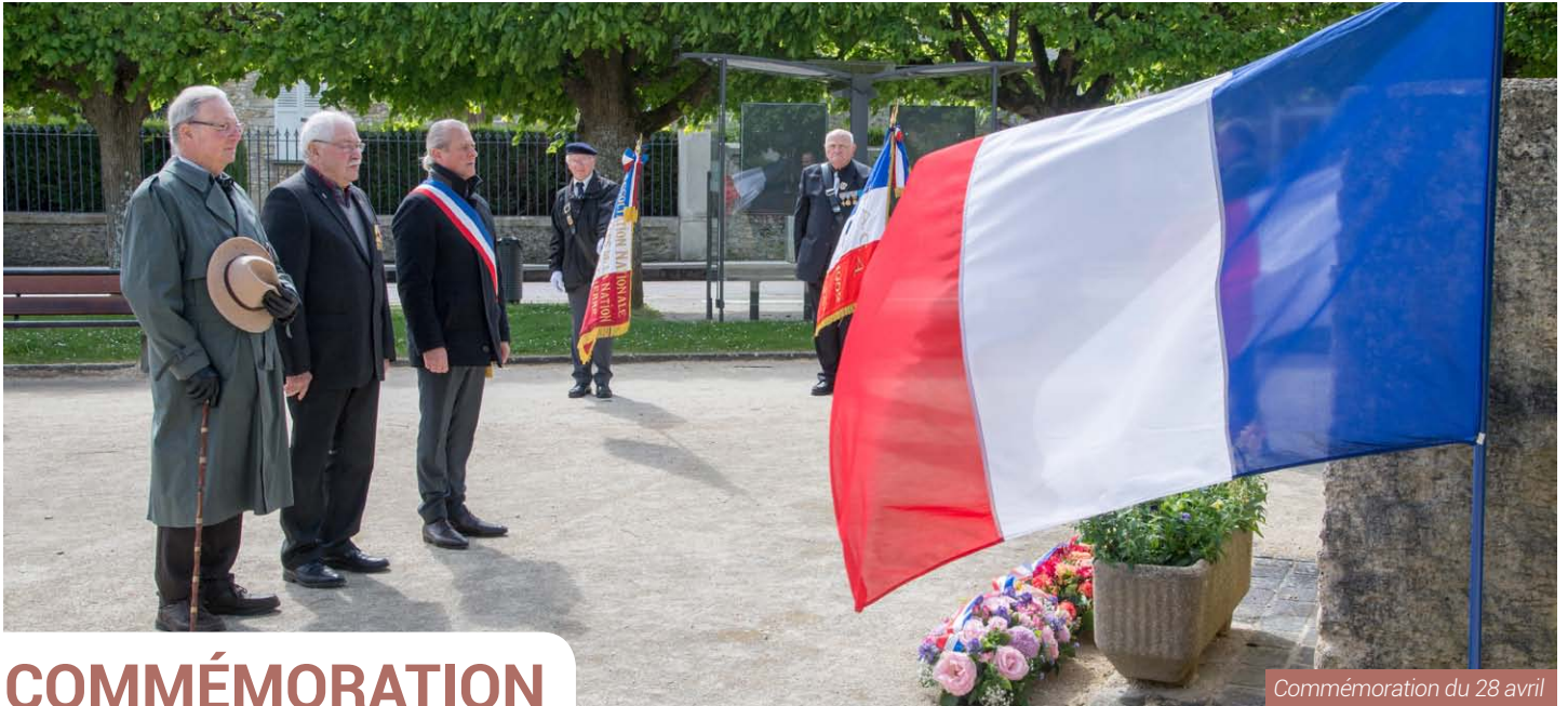
Commémoration du 28 avril