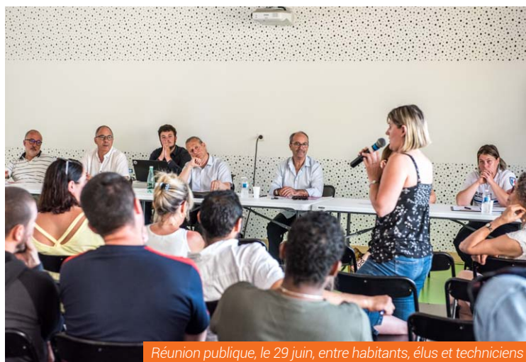
Réunion publique, le 29 juin, entre habitants, élus et techniciens