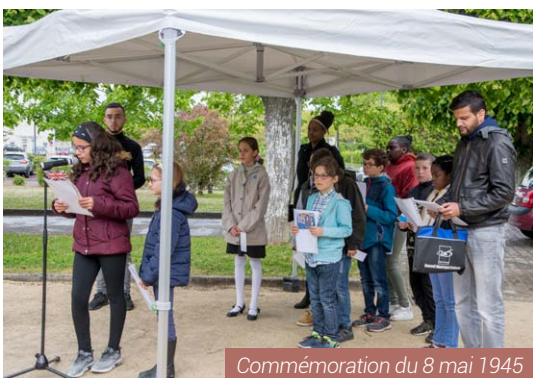
Commémoration du 8 mai 1945