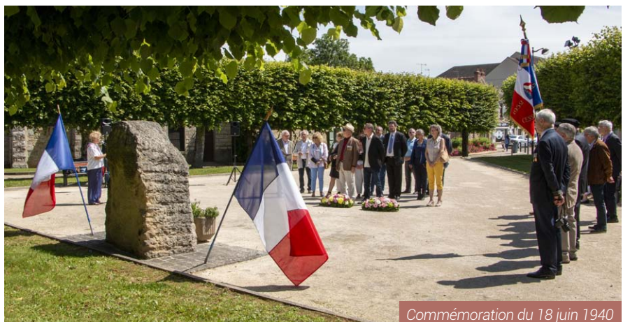
Commémoration du 18 juin 1940