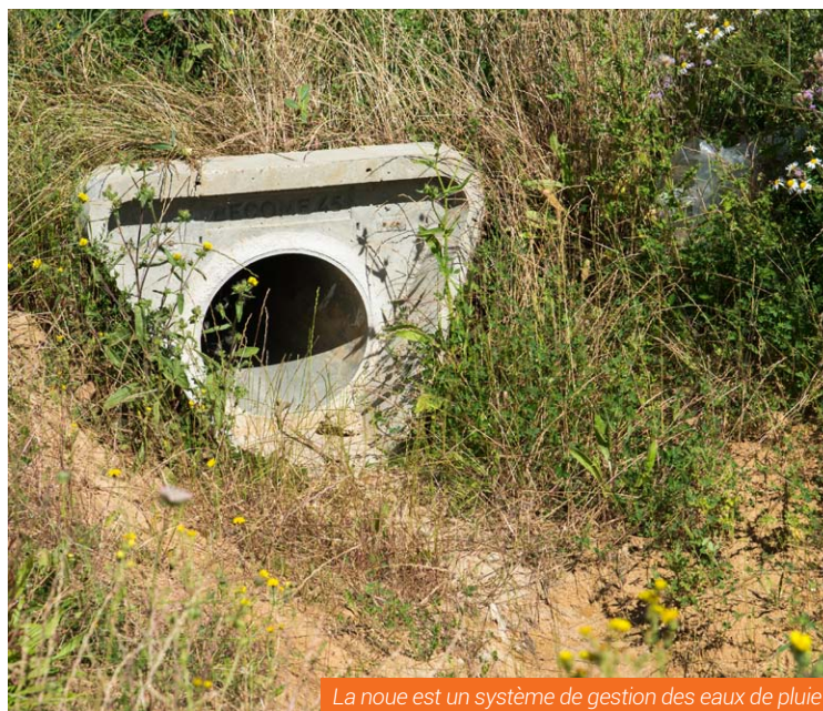
La noue est un système de gestion des eaux de pluie