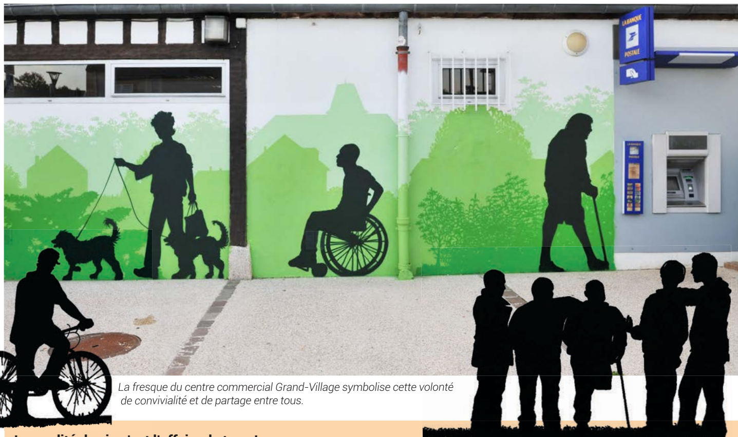
La fresque du centre commercial Grand-Village symbolise cette volonté de convivialité et de partage entre tous.

Deux valeurs pour bien-vivre ensemble la ville