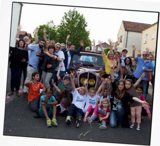
La Fête des voisins en mai, un moment convivial apprécié de tous !

Tout au long de l'année, vous avez la possibilité de signaler à la police municipale et nationale vos absences prolongées. Cela permet aux patrouilles d'axer leurs efforts sur les domiciles inoccupés et de pouvoir vous prévenir plus rapidement en cas de problème. Pour vous inscrire dans le dispositif, avant de partir, présentez-vous à la police municipale ou nationale pour signaler vos dates de début et de fin de vacances.