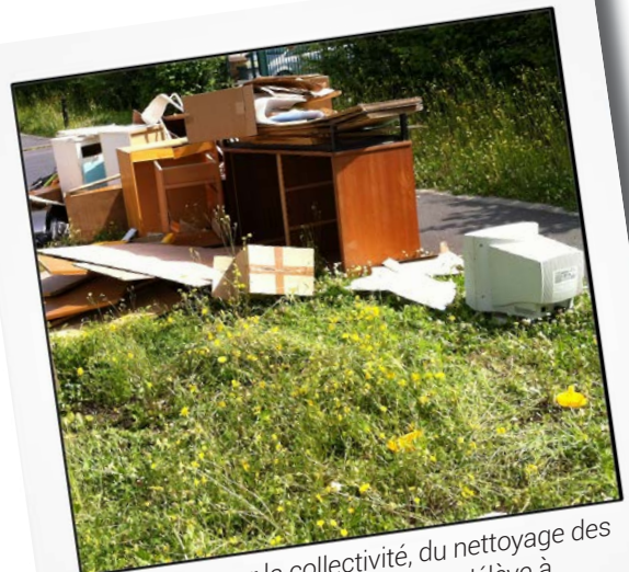
La facture pour la collectivité, du nettoyage des encombrants indésirables, s'élève à 20 000 euros par an ! Pensez à la déchetterie !