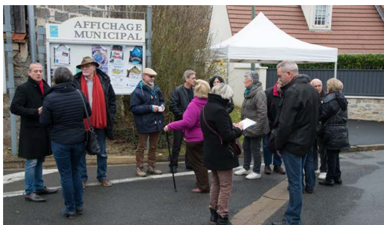
Rencontre au Petit-Jard (en haut à gauche). Rencontre rue Pasteur, place de l'Église (en bas à gauche). Au centre commercial de Grand-Village (en bas à droite)