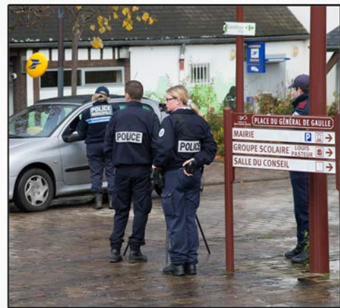
Des collaborations régulières sont mises en place entre polices nationale et municipale