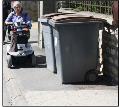
Évitez d'encombrer les trottoirs avec les bacs ou le stationnement des véhicules.

Déposez vos déchets dans les bacs prévus à cet effet, et fermez le couvercle, déposer le bac sur le trottoir. Et de manière à ne pas gêner les piétons, sortez les bacs le plus tard possible (après 20 heures) pour la collecte du lendemain. Les bacs jaunes (emballages) reçoivent aussi les magazines et les journaux.