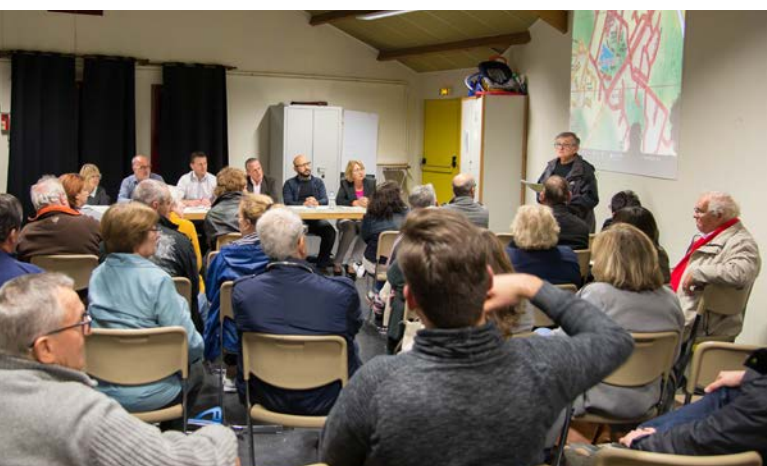
Comité de quartier La Ramonerie / Marches de Bréviande en mairie (photo du haut) et comité Champ-Grillon / Vallée de Bailly dans la salle Irène-Lézine (photos du bas)

Après les débats, les participants ont répondu à vingt-quatre questions sous la forme d'un quizz, comme ci-dessus, sur le thème : Connaissez-vous bien votre commune ?