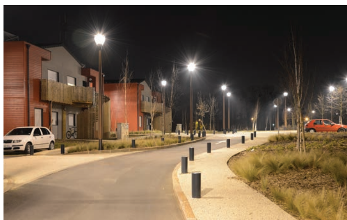
Les travaux de renouvellement des points lumineux liés au marché à performance énergétique de l'éclairage public se poursuivent.