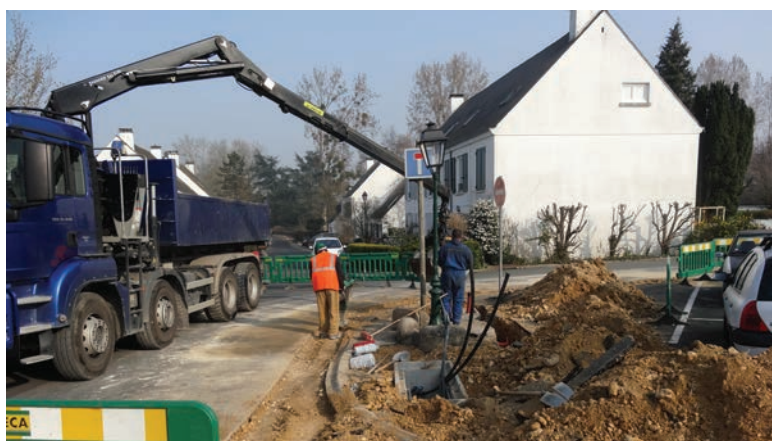
Les travaux d'installation des six caméras de vidéo-protection se terminent. Elles seront opérationnelles en mai.