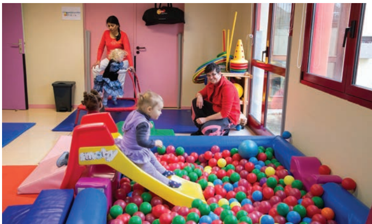
Dans ses locaux, adaptés aux jeunes pensionnaires, la Maison de l'enfance accueille les tout-petits avec leurs assistantes maternelles pour des temps créatifs et socialisants (photos ci-contre, ci-dessus et ci-dessous).

Maison de l'enfance allée Irène-Lézine Tél. : 01 60 63 62 60. Courriels : haltegarderie@vert-saint-denis.fr ou crechefamiliale@vert-saint-denis.fr