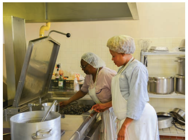
Les repas des enfants sont préparés chaque jour par du personnel qualifié.