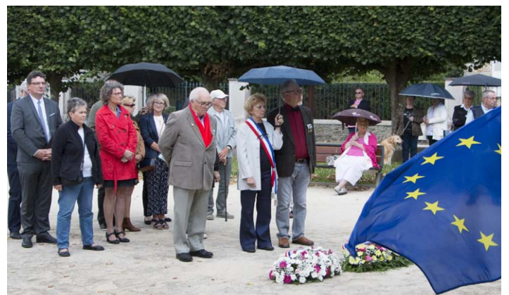
Commémoration du 18 juin 1940

de ce conflit, mais qui reste un des éléments importants pour l'apprentissage à la citoyenneté de notre jeunesse. « Il faut s'appuyer sur les connaissances du passé pour ne pas commettre les fautes qui ont engendré les drames. Nous nous devons de rester vigilants et de transmettre aux jeunes générations les fondements de notre mémoire collective, porteuse de sens, de valeurs de paix, de liberté et de leçons pour l'avenir. »