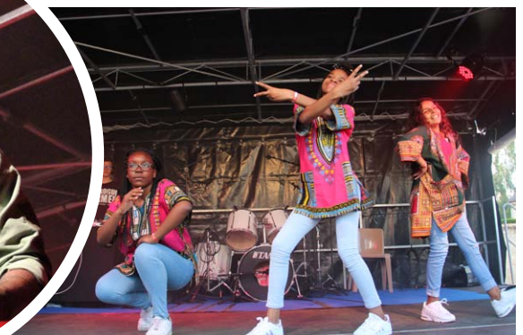
La Team Affro