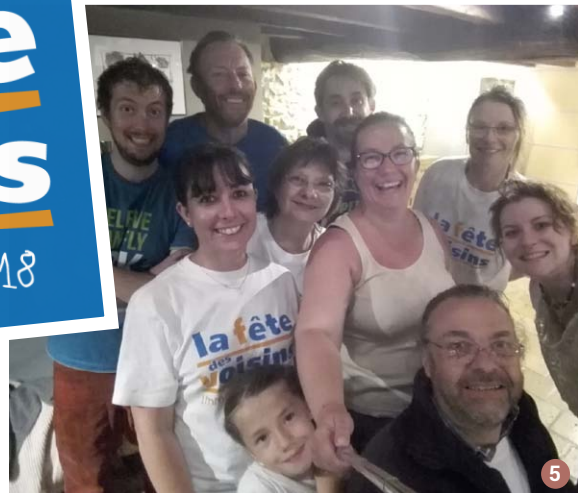
1 et 2 - Rue du Marché-Button.