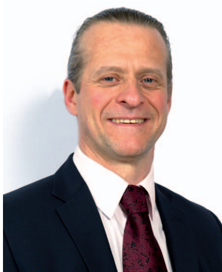
Éric BAREILLE Maire de Vert-Saint-Denis