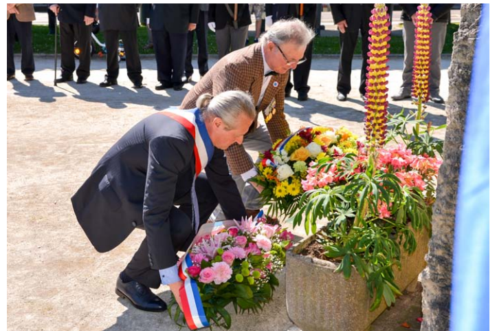
Commémoration du 8 mai 1945

La Journée du souvenir des victimes de la Déportation, qui a lieu le dernier dimanche d'avril, soit le 29 avril cette année. Le 8 mai 1945, la victoire des nations alliées qui consacrait la victoire de la démocratie, des valeurs universelles de la liberté et de la dignité humaine. La France était à Berlin, effaçant la défaite de mai 1940 et l'esprit de collaboration. Et le 18 juin 1940 où, par la voix du général de Gaulle, la France avait dit son refus et sa volonté d'agir pour retrouver sa place au sein des grandes nations, afin de porter son message universel de Liberté, d'Égalité et de Fraternité.