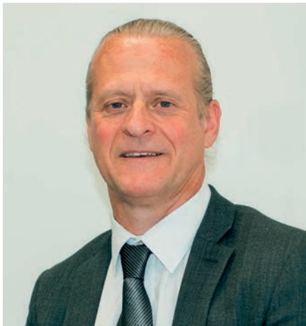
Éric BAREILLE Maire de Vert-Saint-Denis