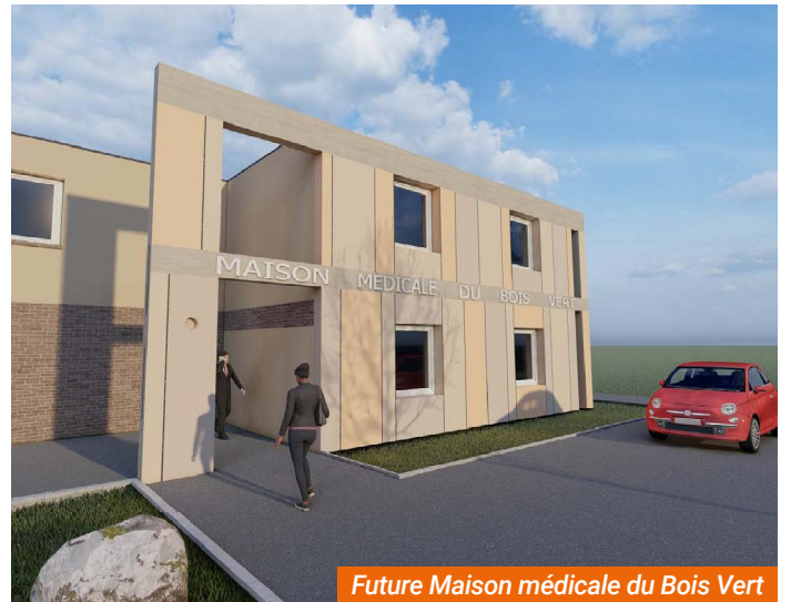
Future Maison médicale du Bois Vert

Ce centre médical accueillera des professionnels de santé, orthophonistes, gynécologues, infirmiers, ostéopathe, la PMI, etc.