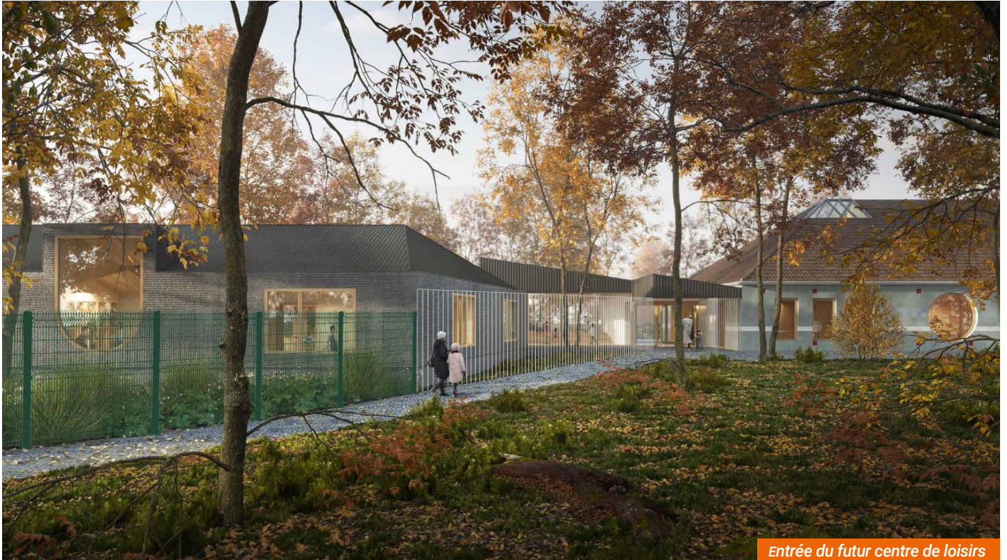
Entrée du futur centre de loisirs