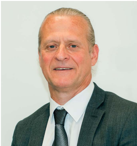
Éric BAREILLE Maire de Vert-Saint-Denis