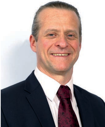
Éric BAREILLE Maire de Vert-Saint-Denis