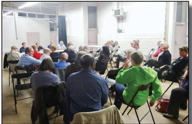
Comité de quartier Balory / La Butte-aux-Fèves le 30 septembre 2015 à l'abri couvert Jean-Rostand.

En constante évolution, les comités de quartier sont l'occasion de nous retrouver entre habitants, élus et techniciens afin de travailler ensemble sur des points d'ordre général à la ville. La session d'automne a pris fin début novembre. Comme précédemment, un tableau des demandes formulées lors de la réunion de votre quartier est disponible sur simple demande via notre site Internet ( www.vert-saint-denis.fr ). Des travaux sont d'ores et déjà réalisés, d'autres sont à l'étude. Des visites sur sites ont déjà été organisées avec les habitants pour préciser certaines demandes. Sur l'ensemble des quartiers, un temps participatif a été mis en place sur le thème de la Fête des quartiers, ouverture de la Fête de la musique 2016. Vous trouverez en page de droite les résultats de cette animation.