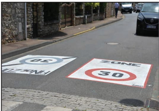
Lors d'une commission sécurité routière, l'absence de marquage au sol zone 30 en centre-ville, avait été pointée par les riverains. C'est depuis chose faite.

Il s'agit de se réunir sur site pour trouver une solution à un problème local concernant une rue ou un petit groupement d'habitants. Stationnement de véhicule, aménagement d'une aire de jeux, sens de circulation de la rue, sont autant de sujets qui demandent un consensus des riverains vivant au quotidien le secteur ciblé. De plus en plus de réunions de proximité sont organisées dans la ville. Ce mode de résolution remporte un vif succès auprès des habitants concernés.