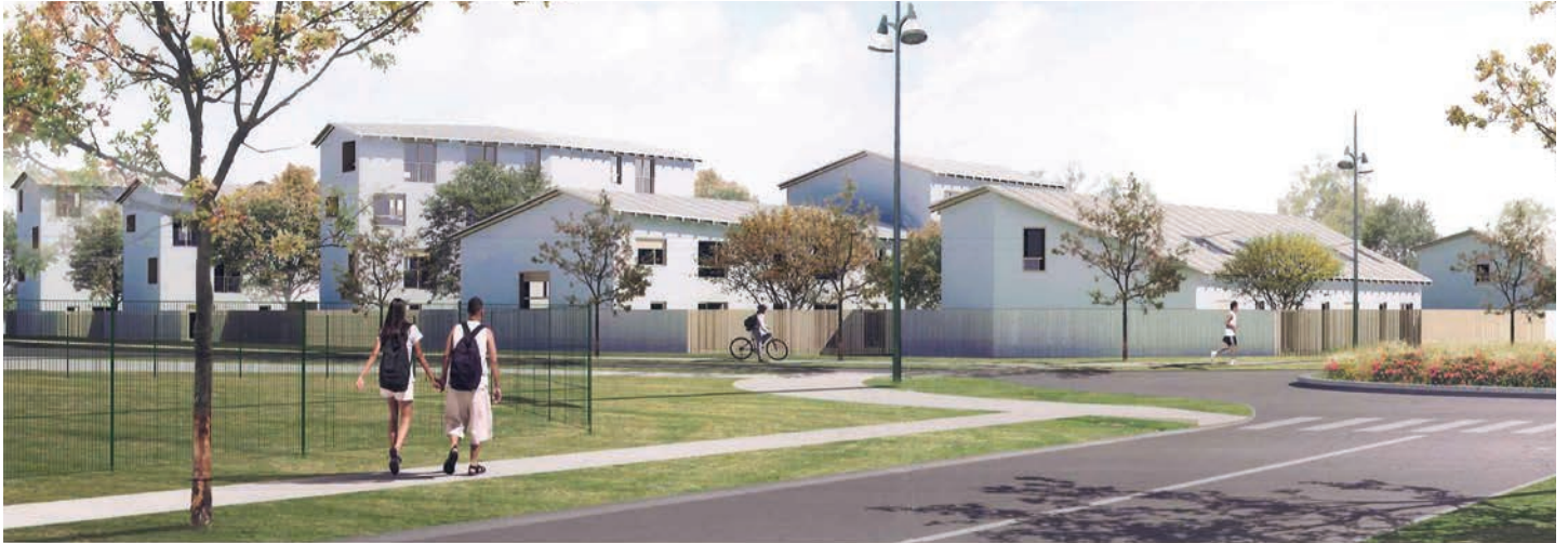
Çi-dessus, le programme de la Résidence urbaine de France (3F), composé de 52 logements locatifs sociaux sera le premier programme de l'écoquartier de la ZAC du Balory à voir le jour, avec une livraison prévue au cours du deuxième semestre 2016.

La ville renforce son offre de logements avec différents programmes immobiliers neufs qui sont en cours ou vont l'être prochainement