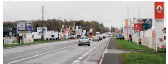
Les abords de la RD 306 au niveau de la zone d'activités Konrad-Adenauer. La surcharge de dispositifs nuit à la qualité paysagère et à la lisibilité des messages.

La délibération a également fixé les modalités de la concertation associées à l'élaboration du futur RLP. La commune a ouvert un registre de concertation disponible en mairie pour recueillir les avis du public pendant la phase d'élaboration du projet de RLP. Ce registre sera accompagné d'un dossier technique alimenté au fur et à mesure de la procédure. La commune organisera une réunion publique de concertation sur le projet de RLP associant notamment les acteurs économiques locaux et les afficheurs (la date et le lieu seront communiqués en temps utile). Son élaboration devrait s'achever par son approbation fin 2016. Le RLP approuvé sera annexé au PLU.